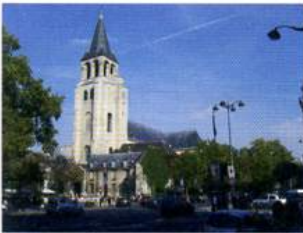
◀ サン・ジェルマン・デ・プレ教会 (l'église Saint-Germain-des-Prés)

ソルボンヌ (la Sorbonne) を中心に北はサン・ジェルマン・デ・プレ (Saint-Germain-des-Prés) から南はリュクサンブール公園 (le jardin du Luxembourg) まで広がる地域。La Sorbonne は、現在ではパリ第1大学、パリ第3大学およびパリ第4大学がその名を引き継いでいるが、その由来は、13世紀に Robert de Sorbon によって、ここに神学生のための寄宿学校が創設されたことにある。当時はもっぱらラテン語によって授業が行われていたことから、この地域は現在でも le Quartier latin と呼ばれている。