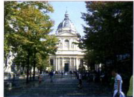
la Sorbonne ▶