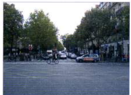
サン・ミシェル大通り (le boulevard Saint Michel) ▶