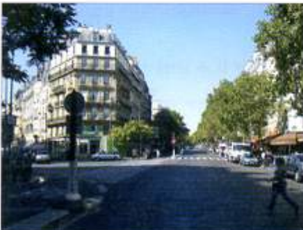
◀ サン・ジェルマン大通り (le boulevard Saint-Germain)